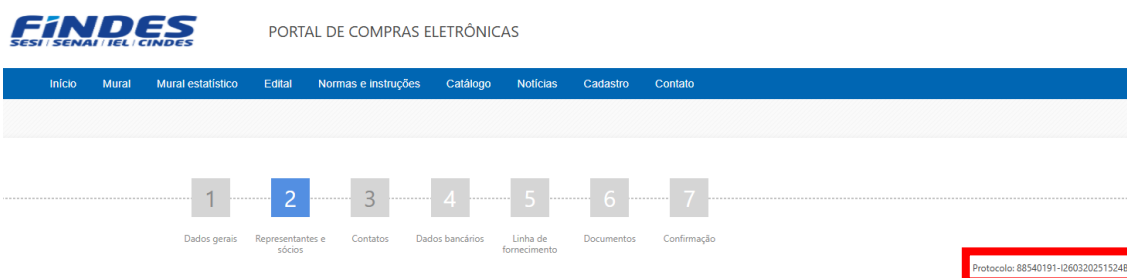
Modelo 1 – Visualização do protocolo

2.3.3. O retorno é realizado a partir da tela “Consulta de Protocolo” apresentada anteriormente.